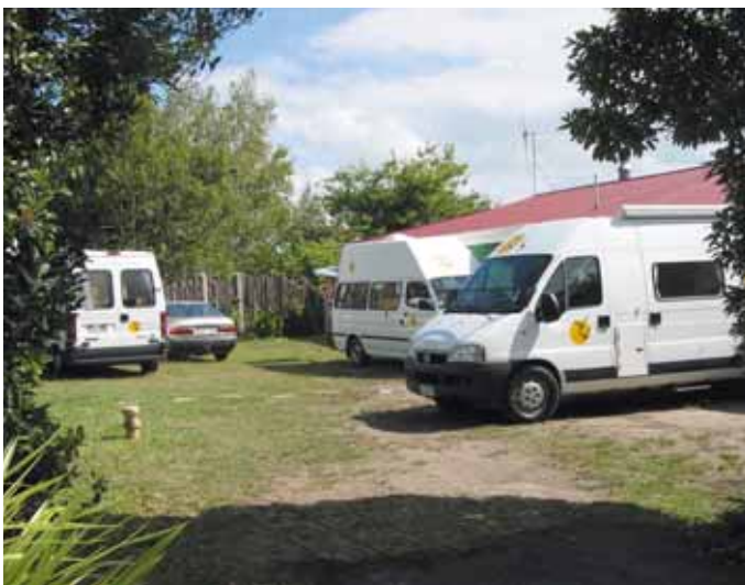
De thuisbasis in Rotorua.